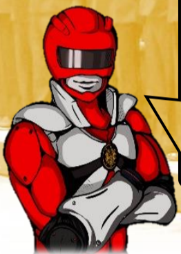
石狩消防署 防火啓発キャラクター FDレッド